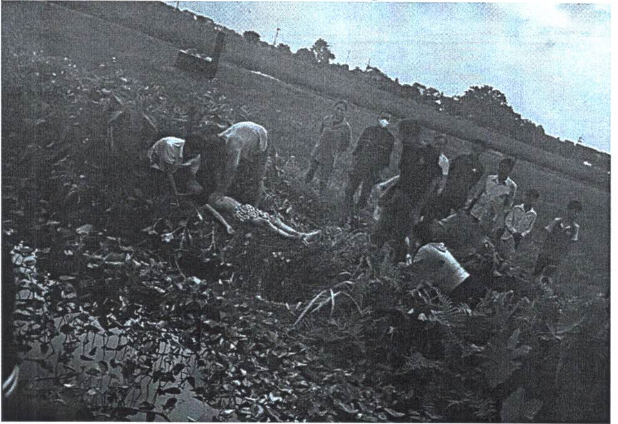
Hình ảnh dẫn chứng.